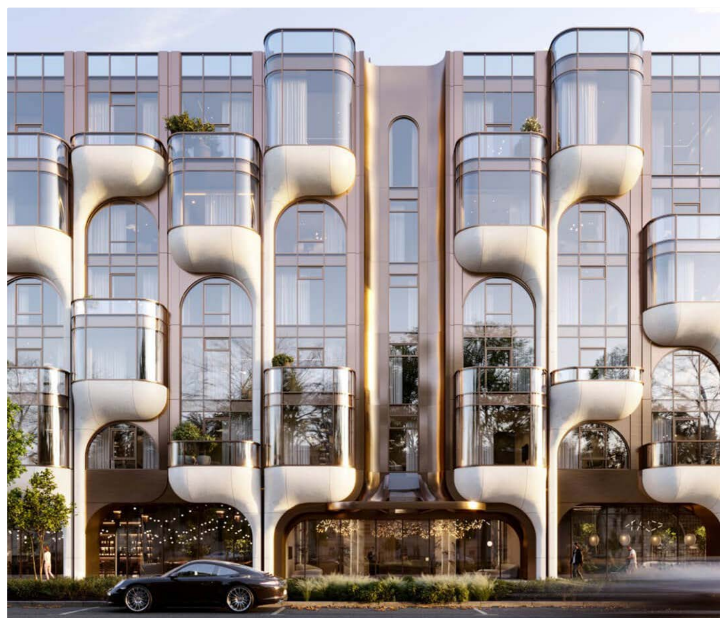
ДЕЛЮКС-РЕЗИДЕНЦИЯ «САВВИНСКАЯ 27»