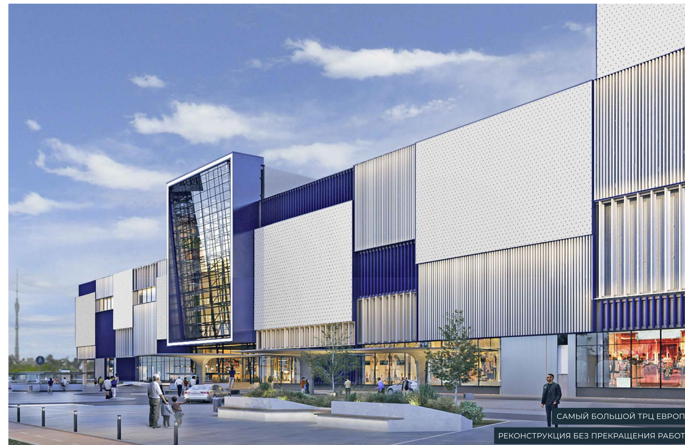
САМЫЙ БОЛЬШОЙ ТРЦ ЕВРОПЫ РЕКОНСТРУКЦИЯ БЕЗ ПРЕКРАЩЕНИЯ РАБОТЫ