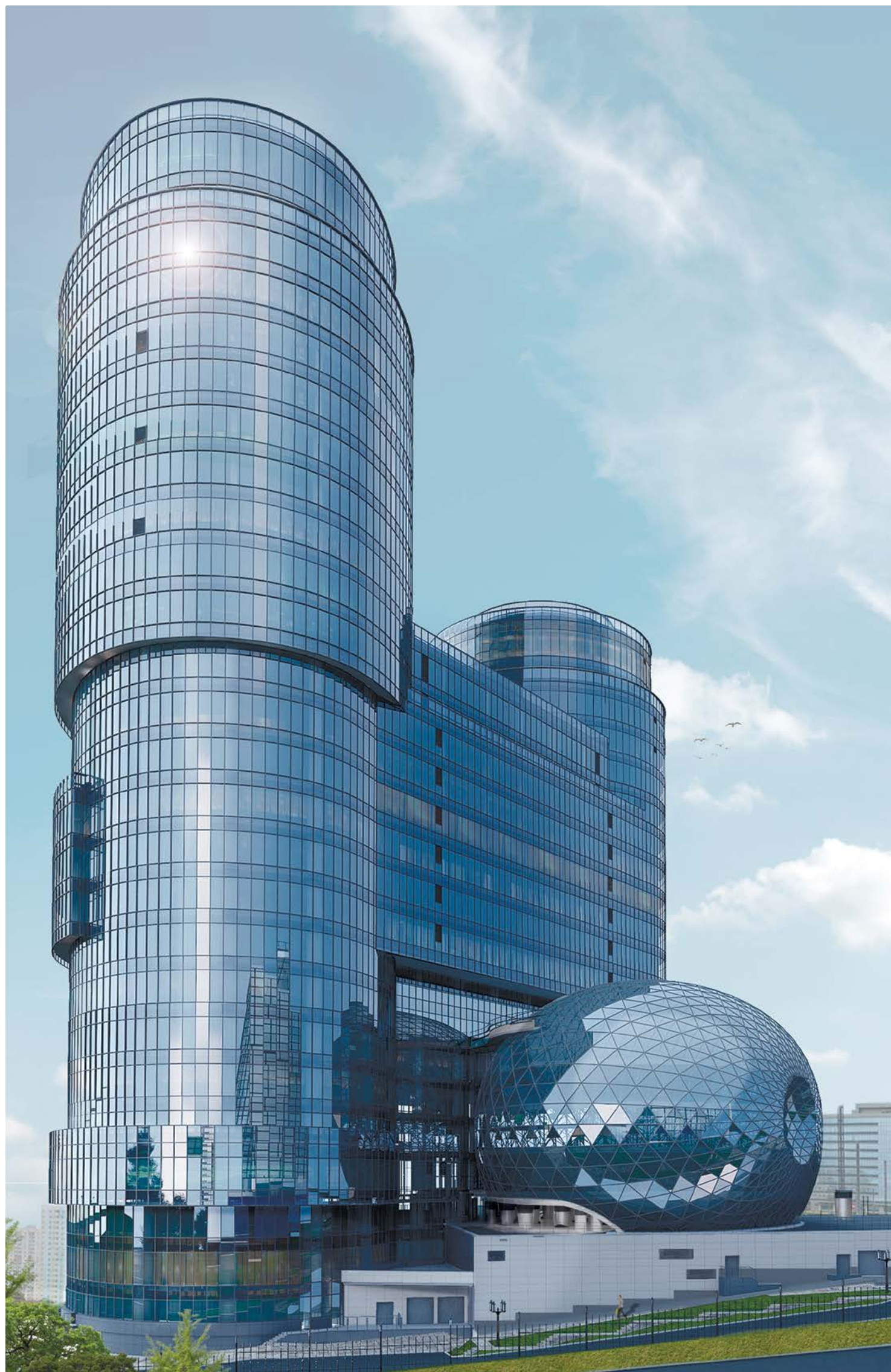
БЦ «ДВА КАПИТАНА»