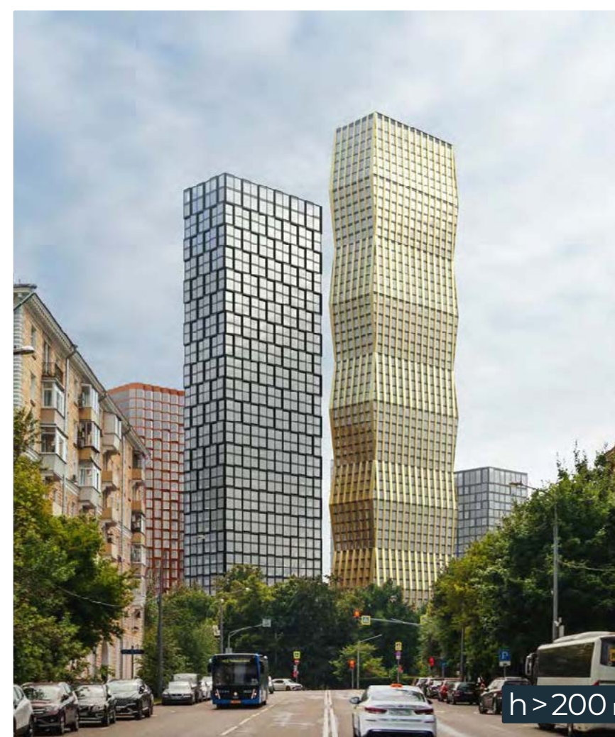
МЖК «КУУСИНА» h > 200 м

Реализуем требуемые разделы проекта, получим согласование экспертизы, разработаем и поддержим защиту альбомов АГР / АГО. Ключ к успешной реализации объекта, будь он типовым или обладающим уникальными объемно-планировочными решениями, в правильном сопряжении архитекторов, инженеров и конструкторов проекта.