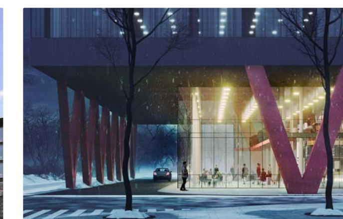
ГОСТИНИЧНЫЙ КОМПЛЕКС «МАГИСТРАЛЬНЫЙ»